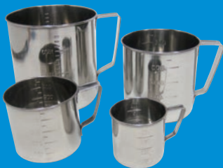
目盛付コップ (KU) P.66