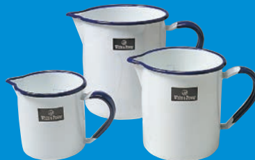
ホーロー ビーカー P.64