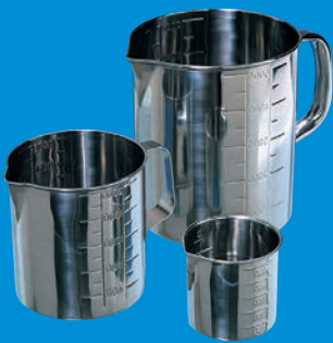
口付ビーカー (プレス) P.62