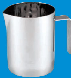
サニタリー 口付ビーカー P.63